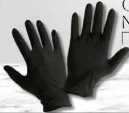
Paquete 1 Par - Caja x 100 unidades