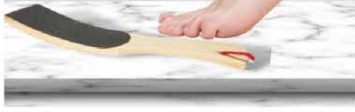
Raspacallos de Madera